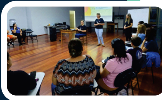
Secretaria Municipal Educação