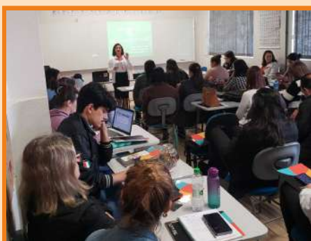
Palestra sobre os Desafios da Adolescência para professores da EEB São Francisco