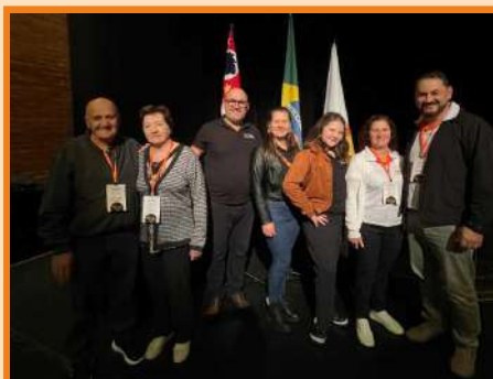
Congresso Nacional EPB SP