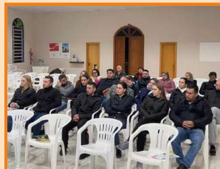
Conversa com casais do curso de Preparação para o matrimônio na Comunidade São Lucas