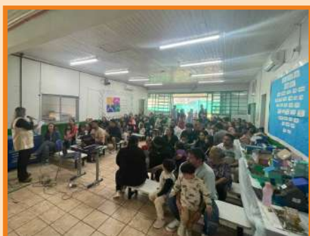
Palestra EBM Cruz e Souza