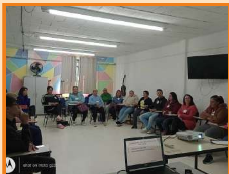
Conversa com pais e mães Adolescência no CREAS Inovamente