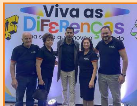
Participação no evento "Viva as diferenças" no Centro de Eventos Plínio Arlindo de Nês