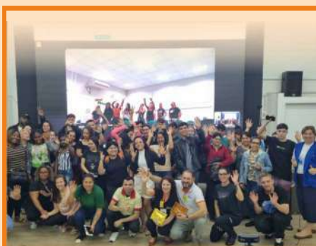
Palestra para alunos da EJA/SESI