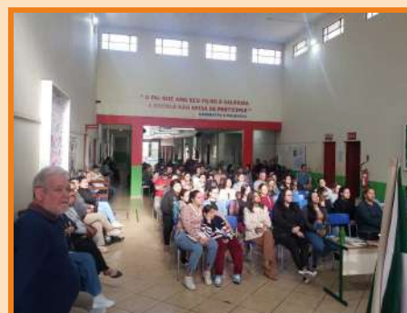
Palestra EEB Saad Antonio Sarquis