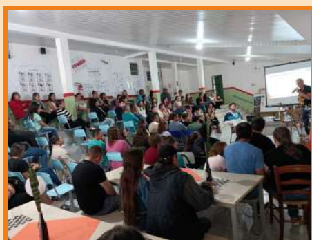
Palestra EEB Serafin Enoss Bertaso