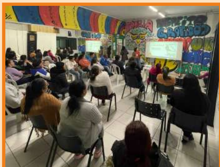
Círculo de debates Programa Verde Vida