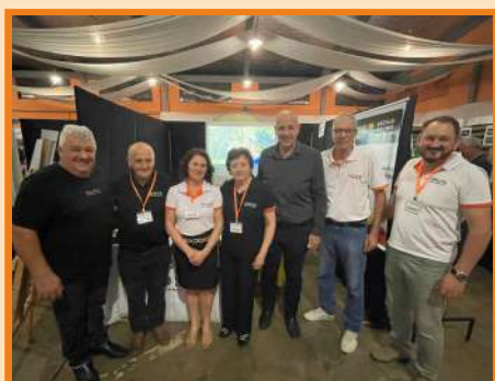
III Mostra do Conhecimento em Nova Itaberaba/SC