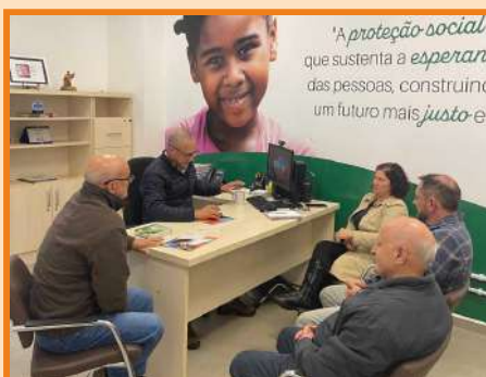
Reunião de planejamento na Secretaria da Família e Proteção Social de Chapecó