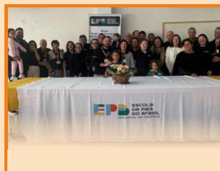
Revisão Regional Oeste