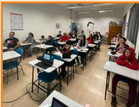
Conversa com pais e mães Adolescência EEB São Francisco