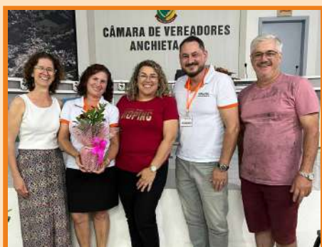
Palestra Câmara de Vereadores Anchieta/SC