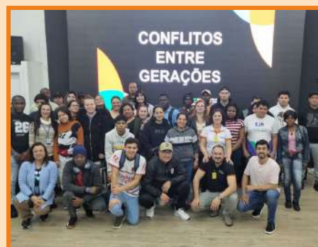
Palestra sobre Conflitos entre gerações para EJA/SESI