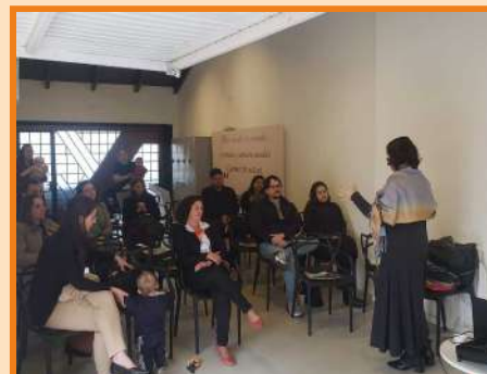
Conversa com pais e mães do Grupo Acolher