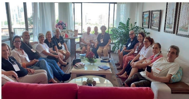
Revisão da EPB – Salvador Em 22 de março de 2025