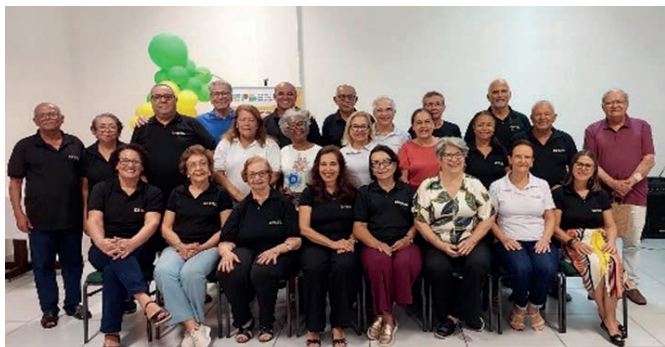
Revisão Estadual da Bahia – em Alagoinhas. Em 22, 23 e 24 de agosto de 2025