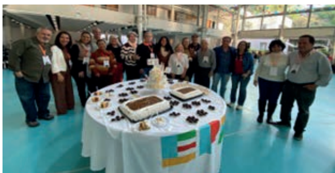
Delegação do Nordeste no Congresso Nacional em 19, 20 e 21 de junho de 2025. Salvador, Alagoinhas, Teotônio Vilela e Recife