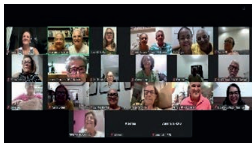
Reuniões mensais de Integração das Seccionais EPB da Bahia e Alagoas